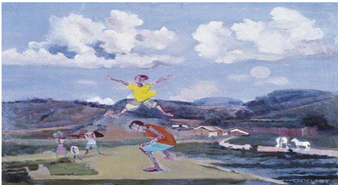
Meninos pulando carniça

http://portaldoprofessor.mec.gov.br/fichaTecnicaAula.html?aula=25659