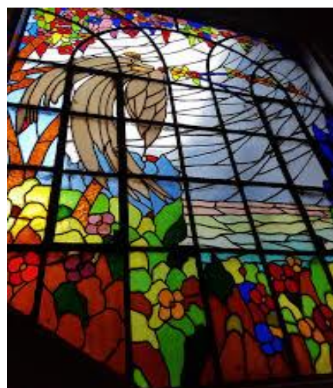
Vitrais da Catedral de Petrópolis - RJ

https://pt.wikipedia.org/wiki/Catedral_de_Petr%C3%B3polis