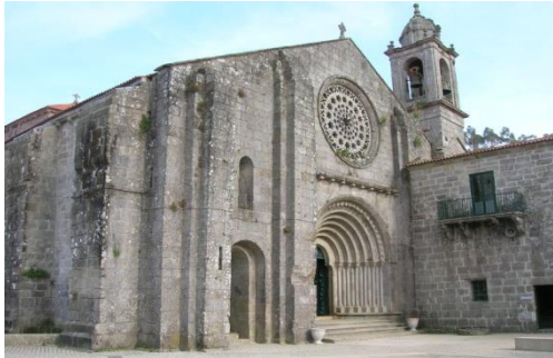
Meis, Espanha https://pt.wikipedia.org/wiki/A_Armenteira_(Meis)