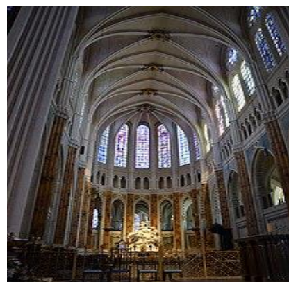
vista da abóboda