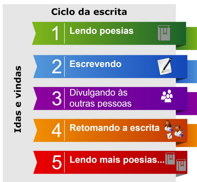
Figura 1- Ciclo da escrita poética

As primeiras poesias, geralmente, escrevemos para nós mesmos, mas com o decorrer do tempo, vamos ganhando segurança e tomamos coragem para escrever para outras pessoas lerem, e nessa onda de idas e vindas, quase sempre seguimos esses passos: