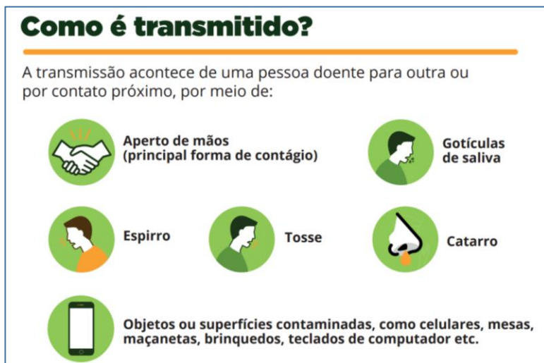
Figura 1 - Como o coronavírus é transmitido?

Veja essa imagem e indique mais adiante quais são as principais formas que o vírus vai pegando a sua carona com as pessoas.