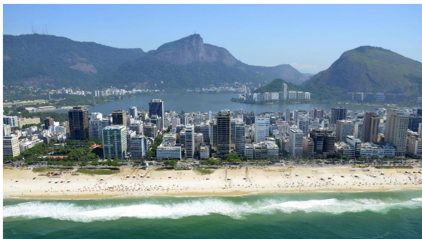
Paisagem da zona sul do Rio de Janeiro.