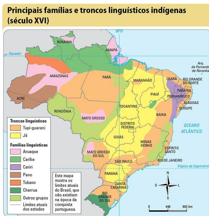
Figura 1 – Mapa com a distribuição dos principais troncos e famílias linguísticas indígenas brasileiros antes da chegada dos portugueses, em 1500.

Antes da chegada dos portugueses, a porção da superfície terrestre atualmente denominada de Brasil era ocupada por centenas de povos e nações indígenas diferentes. Assim, havia uma imensa diversidade de povos com suas diferentes línguas e culturas distribuídas pelo litoral e interior do País antes da chegada dos ditos descobridores portugueses.