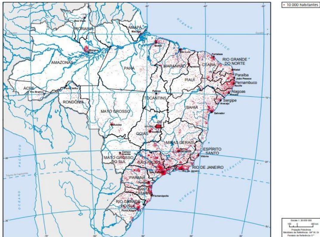
Figura 3 – Mapa ilustrando a concentração populacional no Brasil.