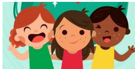
FAZER NOVOS AMIGOS

10. O QUE VOCÊ GOSTA DE FAZER SOZINHO (A)? O QUE GOSTA DE FAZER COM AMIGOS (AS)? DESENHE EM CADA ESPAÇO.