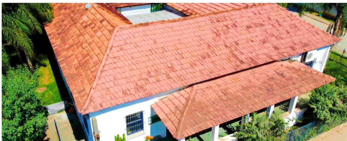
SEDE ADMINISTRATIVA DO MUSEU VIVO DO SÃO BENTO