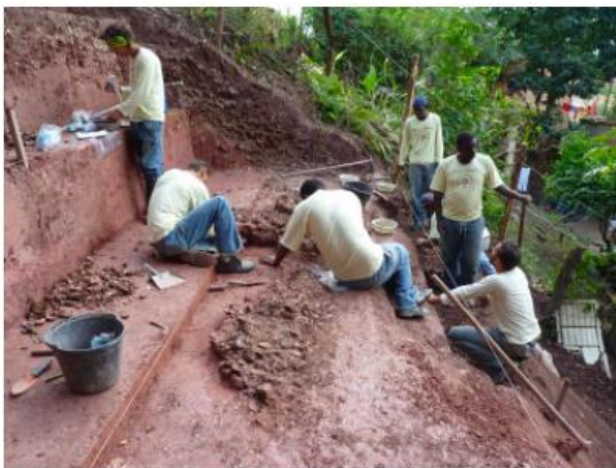
Em 2010 - O IAB fez a Pesquisa do Sambaqui de São Bento.