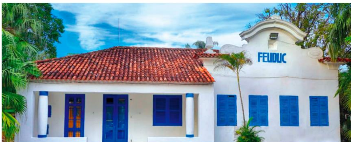
CASA DO ADMINISTRADOR

Hoje temos alguns equipamentos culturais na cidade que guardam um pouco desta história. Um deles é o Museu Vivo do São Bento, que é um Ecomuseu de Percurso. Foi o primeiro a ser criado na Baixada Fluminense em 3 de novembro de 2008. A seguir, algumas fotos do museu: