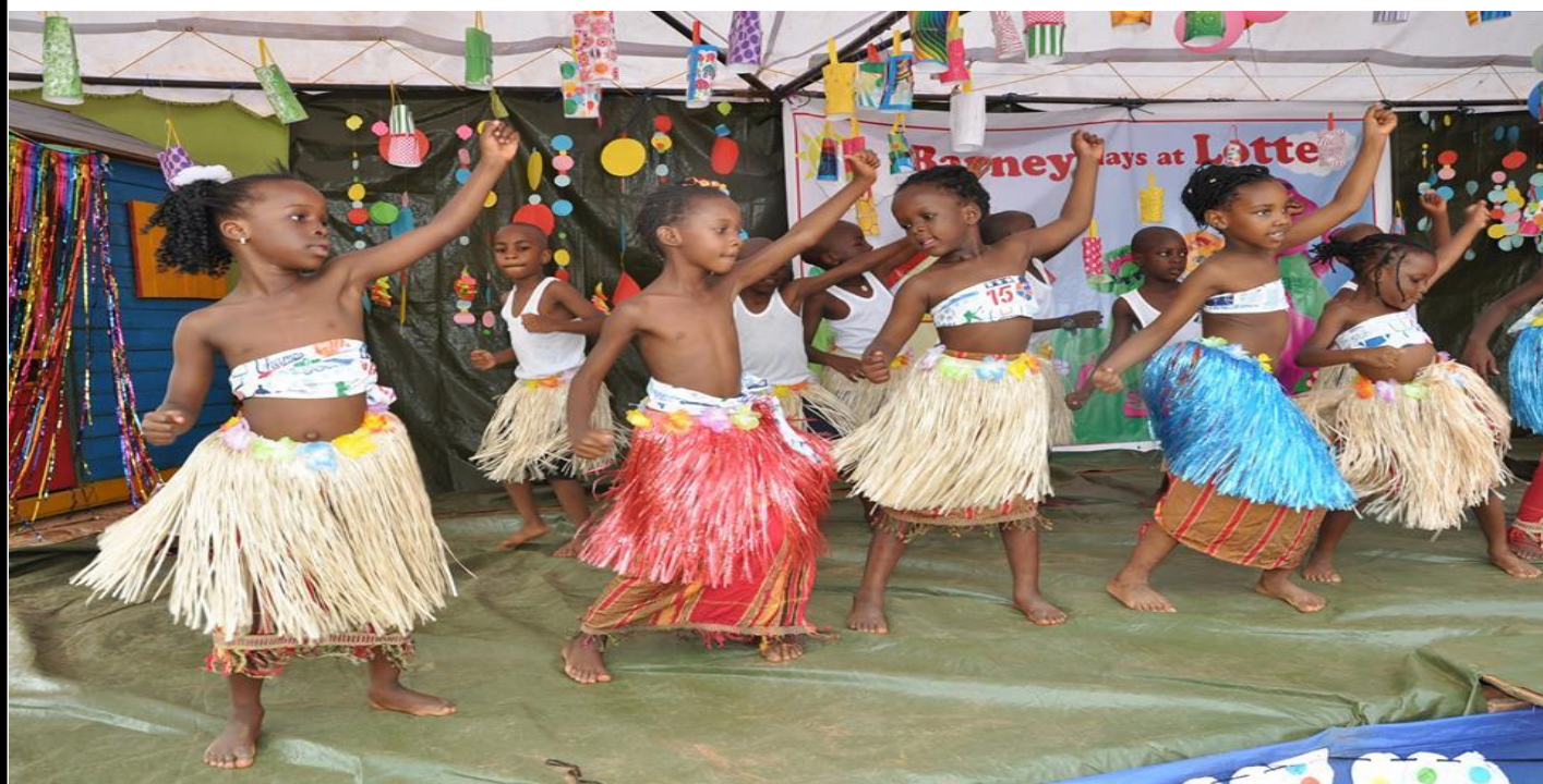
THEY WERE DANCING YESTERDAY. (Eles estavam dançando ontem.)

Considere que esta foto foi tirada ontem. O que eles estavam fazendo ontem?