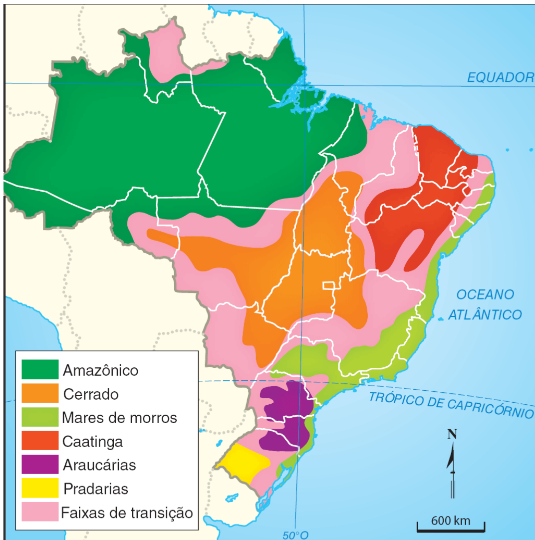
Figura 1 – Domínios Morfoclimáticos do Brasil.