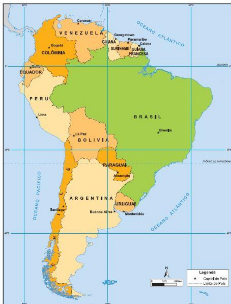
Figura 2 – Mapa da América do Sul.

Toda a fronteira terrestre brasileira limita seu território com outros países da América do Sul. São 10 países que fazem fronteira com o Brasil e seus estados, desde o Amapá até o Rio Grande do Sul. Apenas 2 países da América do Sul não fazem fronteira com o Brasil. Quando se fala em fronteira marítima, o Brasil é um país banhado pelo Oceano Atlântico, correspondendo a uma faixa de 12 milhas náuticas que se estende por mais de 7.300 km de extensão, um dos maiores litorais do mundo.